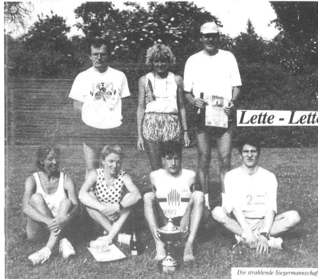
Die strahlende Siegermannschaft